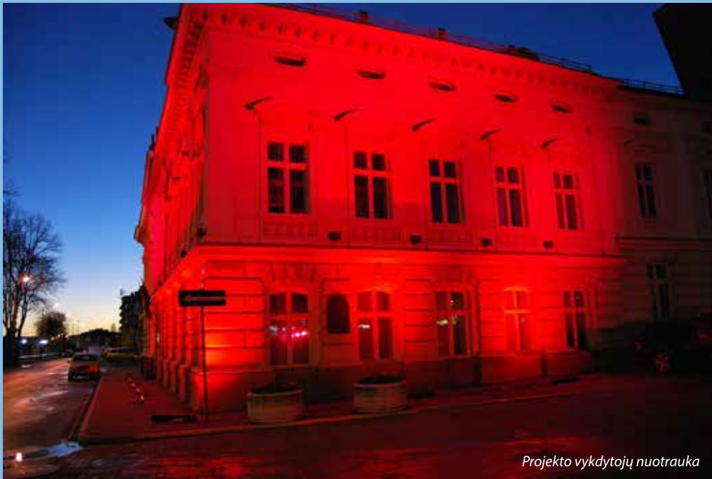
Projekto vykdytojų nuotrauka

Žmogaus imunodeficitą virusas (ŽIV) – XXI amžiaus maru vadinama liga, kuria Lietuvoje užsikrečia vis daugiau žmonių. Akvizitinio imunodeficitą sindromas (AIDS) – paskutinė ŽIV infekcijos stadija. Užkrečiamųjų ligų ir AIDS ligų centro (ULAC) duomenimis, 2016 metais Lietuvoje užregistruota 214 naujų užsikrėtimo ŽIV atvejų: 165 vyrams ir 49 moterims. Iš viso iki 2017 metų sausio 1 dienos Lietuvoje ŽIV infekcija diagnozuota 2749 asmenims, iš kurių daugumą – 79,4 proc. – sudaro vyrai, 18 proc. (496 asmenims) visų užsikrėtusiųjų buvo diagnozuota AIDS. Tačiau problema yra ne tik didėjantis užsikrėtusiųjų skaičius, bet ir tai, kaip