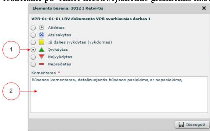
Paveikslas 2. Svarbiausio darbo būsenos pateikimo grafinė naudotojo sąsaja

Vyriausybės prioritetų svarbiausių darbų vykdymo būsenos nustatomos ir keičiamos naudojantis žemiau esančiame paveiksle iliustruojamomis grafinėmis naudotojo sąsajomis.